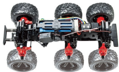
走破性をより高めたG6-01TRシャーシ

○GF-01シャーシ対応のオプションパーツにも対応※1(タミヤHPのパーツマッチングデータも更新済み)。最初からチューンナップも楽しめます。