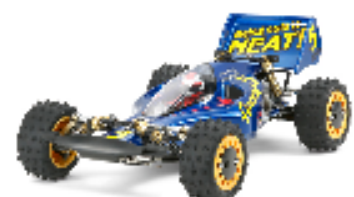
58489 アバンテ(2011) 54,800円 3月15日発送