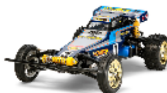
58577 ノバフォックス 19,800円 2月27日発送