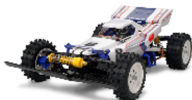
58418 ブーメラン(2008) 16,800円 2月27日発送

《再入荷情報》 ビッグウィング(2017)の登場に合わせて復刻バギーの人気モデルが再入荷します。